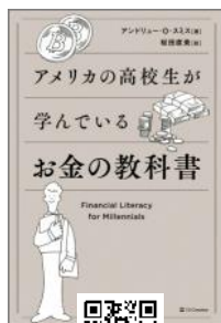
338 || ア 資料ID:100147011

3類には法律・経済・教育や軍事も含まれ、性教育の絵本やジェンダーに関する資料のリクエストもこの類に配架されている。