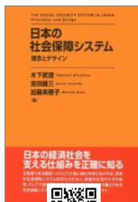
364.021 || ニ 資料ID:100142229