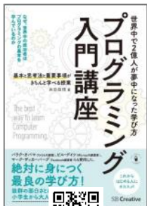
007.64 || パ 資料ID:100142650