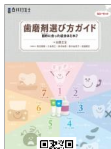
497.9 || シ 資料ID:100148704