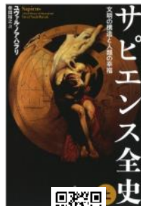
209 || サ || 1 資料ID:100138116