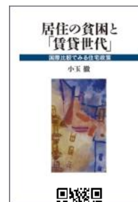
365.31 || キ 資料ID:100141484