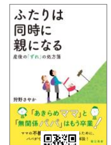
367.3 || フ 資料ID:100142285