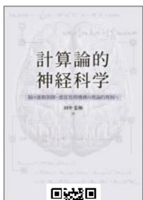
491.371 || ケ 資料ID:100148188