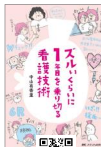
N210 || ズ 資料ID:100139819