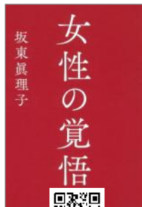
159.6 || ジ 資料ID:100149470